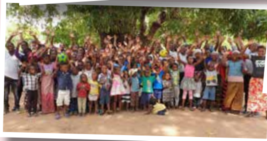
Bildet over: Hele teamet vårt og familiene deres samlet til julefest